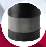
SBA 3-35 AW SBA 3-45 AW