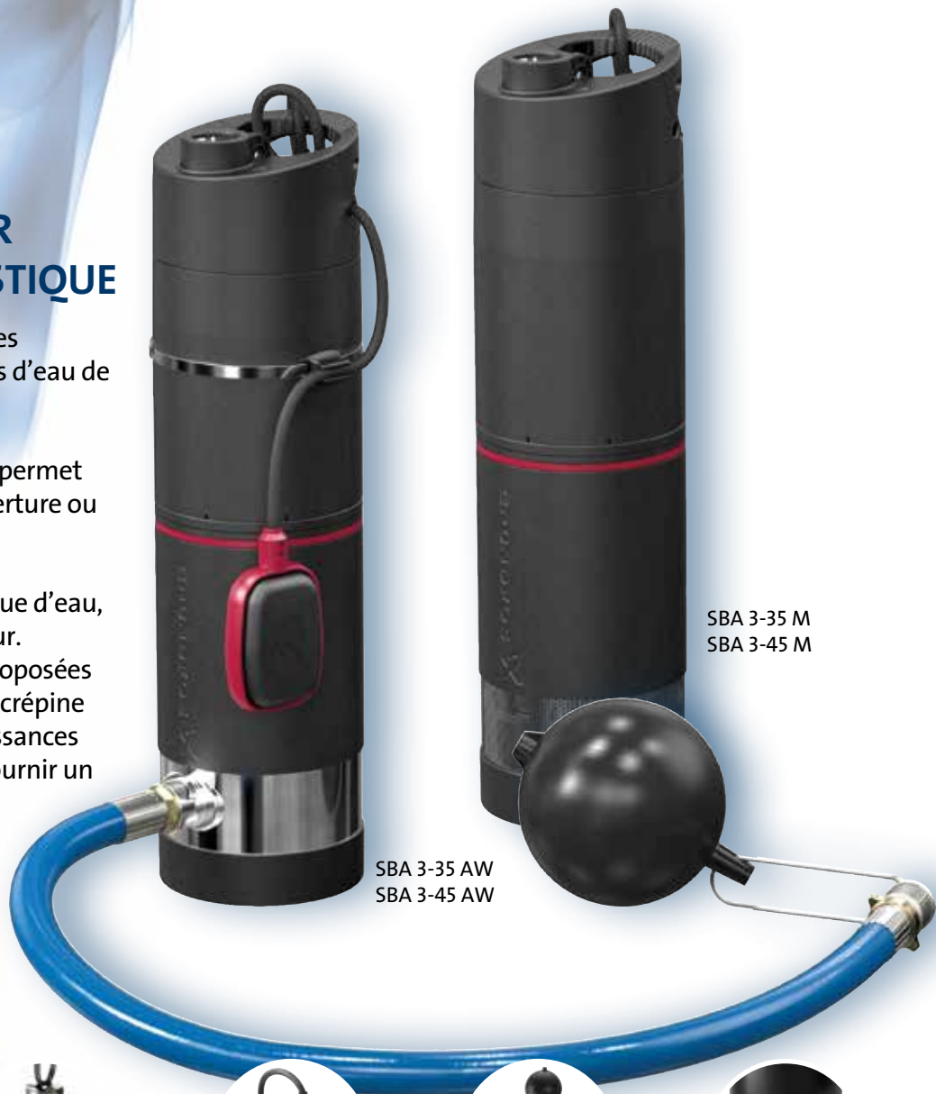
SBA 3-35 M SBA 3-45 M

Livrées avec 15 m de câble et prise, les pompes immergées SBA sont prêtes à être installées et aucun accessoire complémentaire n'est nécessaire pour qu'elles puissent fonctionner.